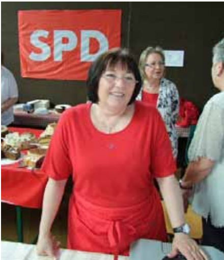
Böhl-Iggelheim: die SPD-Frauen beteiligten sich wie jedes Jahr an Lätäre mit einem Kuchenverkauf.