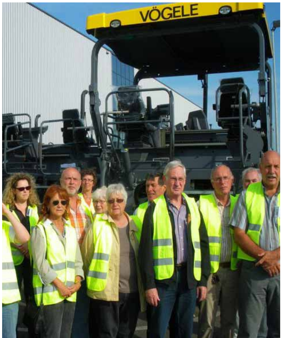
Maudach: Am 5. Mai besuchte der Ortsverein Maudach gemeinsam mit interessierten Bürgern das neue Werk der Firma Vögele in Rheingönheim. Zu sehen waren neben den Produktionshallen und der größten Straßenfertigungsmaschine der Welt auch die moderne Ausbildungswerkstatt, wo bis zu hundert Lehrlinge der Firma ausgebildet werden.