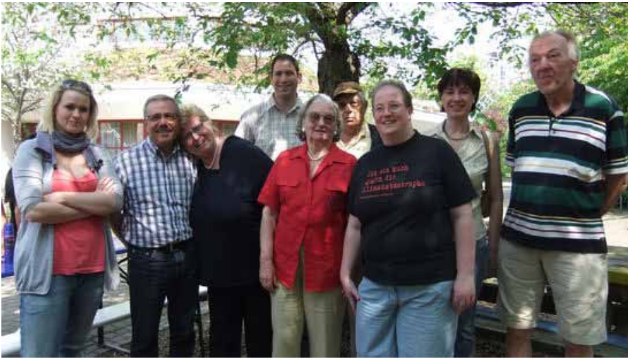
Unser Team zum Kinderfest am 21. April 2011

Wir freuten uns, weil soooooo viele Kinder gekommen waren und mit uns aktiv waren. Da wurde der Luftballon rasiert, da wurde mit Knete hantiert