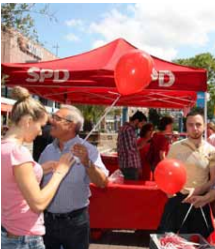
Publikumsmagnet in der Ludwigshafener Innenstadt ist das „Rote Frühstück“ der SPD Südliche Innenstadt.

Fünfmal im Jahr immer Samstags mit einem Themenschwerpunkt.